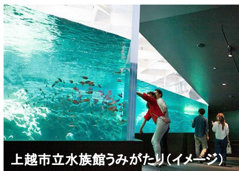
上越市立水族館うみがたり(イメージ)