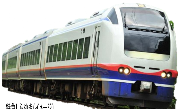
特急しらゆき(イメージ)