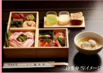
三段重弁当(イメージ)

国内最大級の車窓から越後の 景観と旬の食材を使用した料理を お楽しみいただけます。